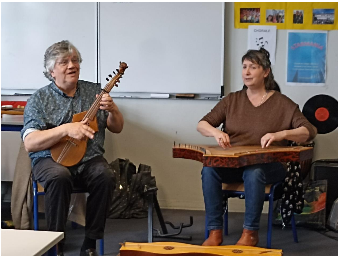
La citole et le psaltérion