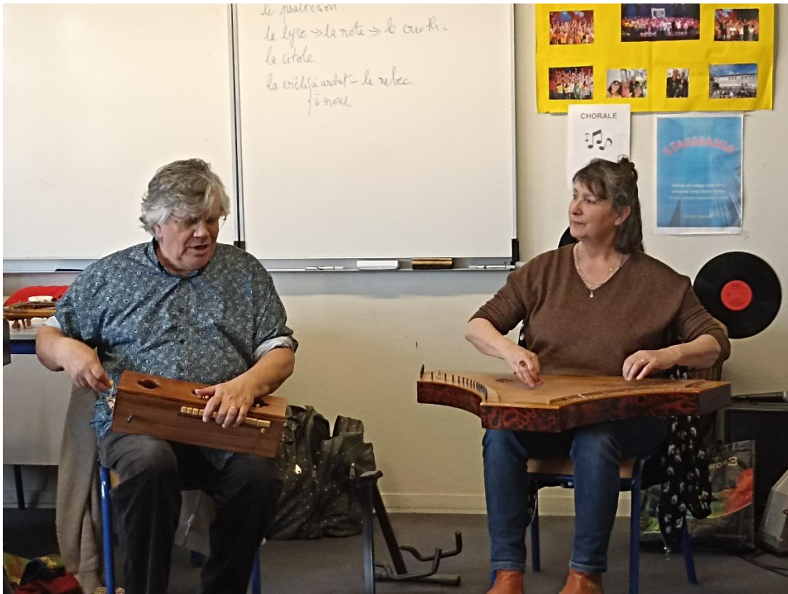
La vièle à roue et le psaltérion