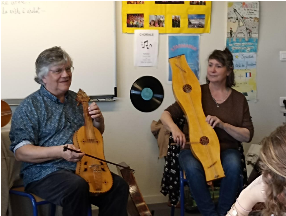
La vièle à archet et le tambour à cordes