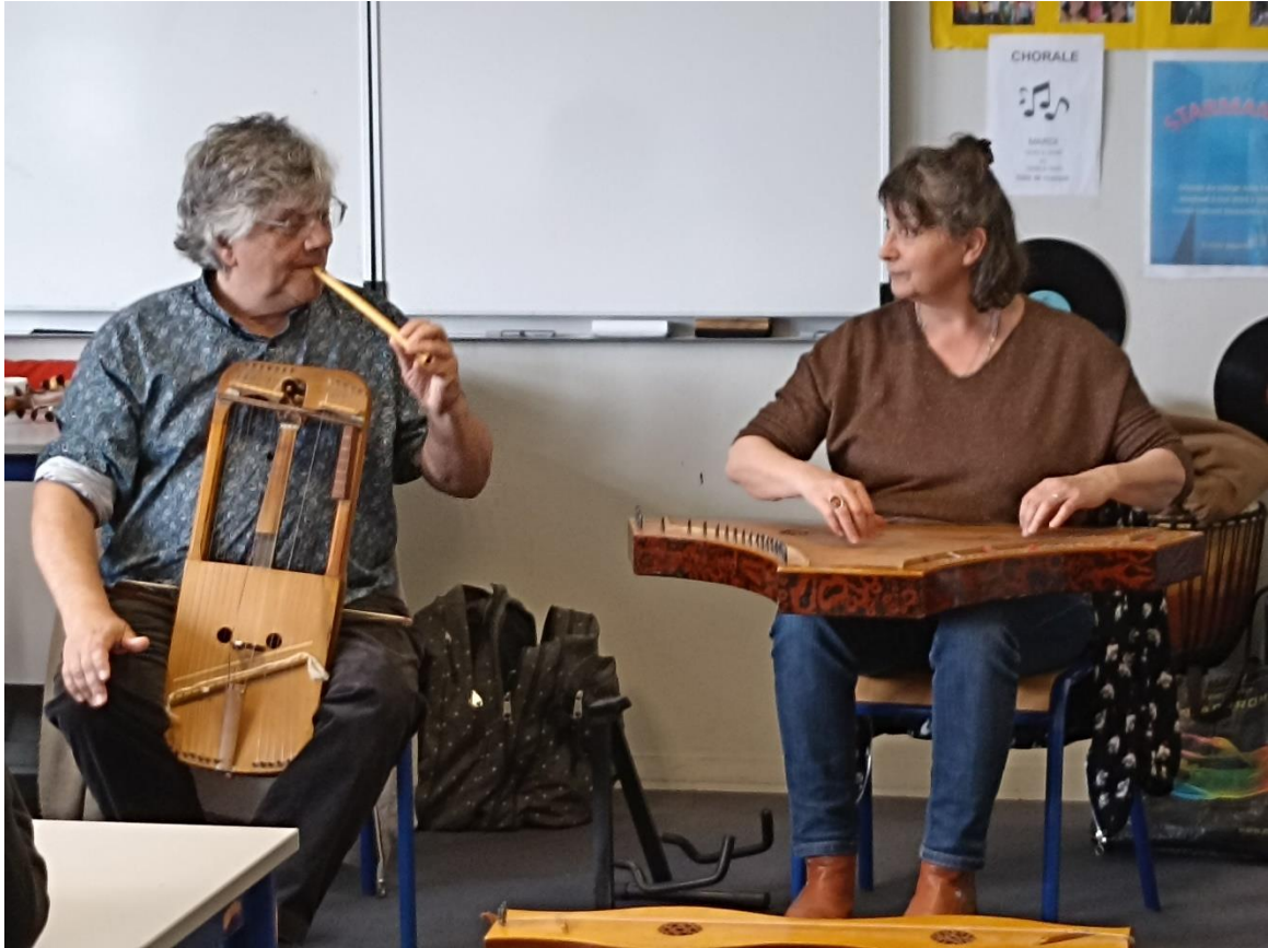
La rote, la flûte et le psaltérion